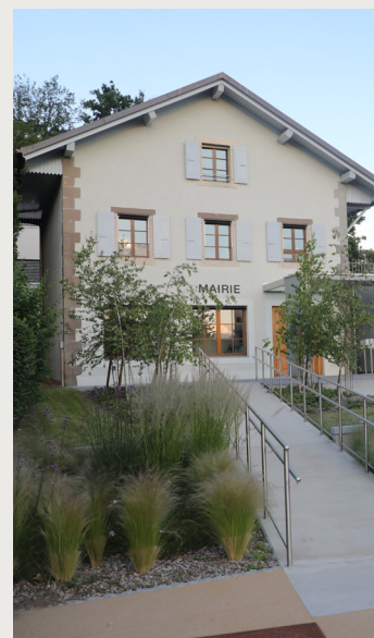
Mise en page : Expression créative Impression : Imprimerie du Moleson SA