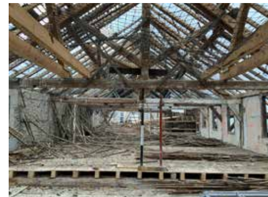
AVANCEMENT TRAVAUX NOUVELLES CHARPENTES